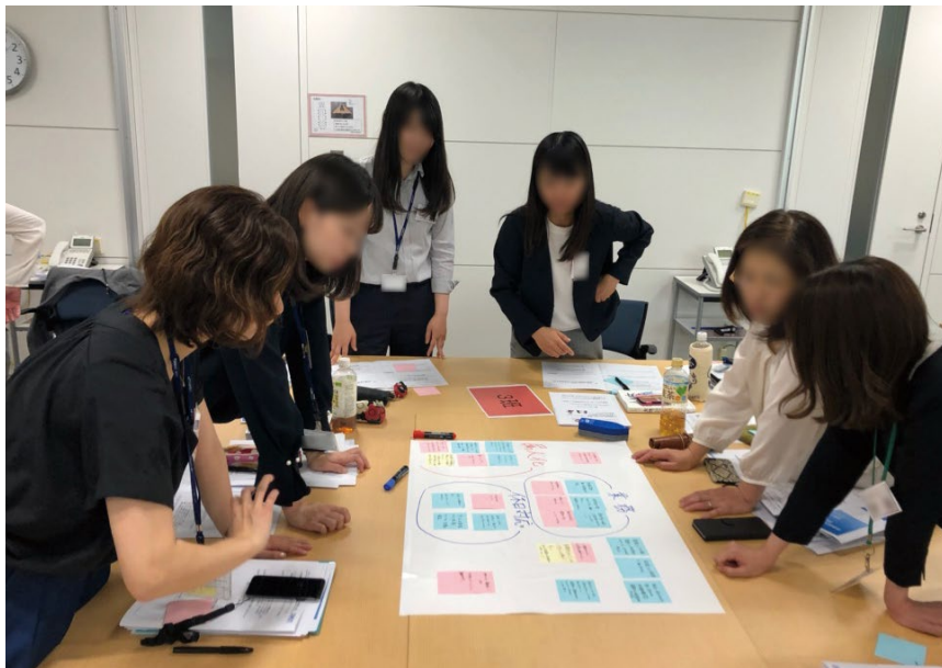
若手女性従業員の活躍が進む会社では、「女性社員交流会」で部門を越えて女性社員同士が交流。