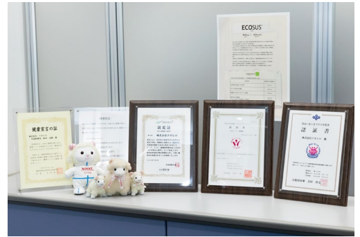
エントランスには「大阪市女性活躍リーディングカンパニー認証書」等、たくさんの認定証が飾られている。