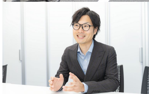
新店オープンなどの際に人員補助を行う「店舗支援課」が関西・関東にそれぞれあるため、育児などで従業員が不足する場合にも迅速に対応できる。