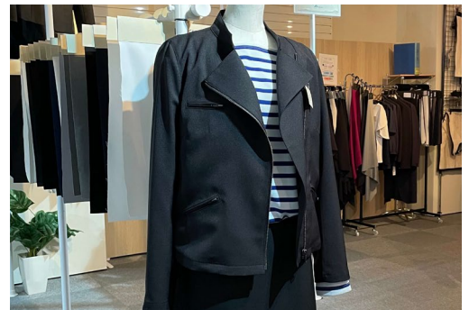
ナカヒロが開発した、「エコ」で「サステナブル」な素材「ECOSUS（エコサス）」を使用した製品。