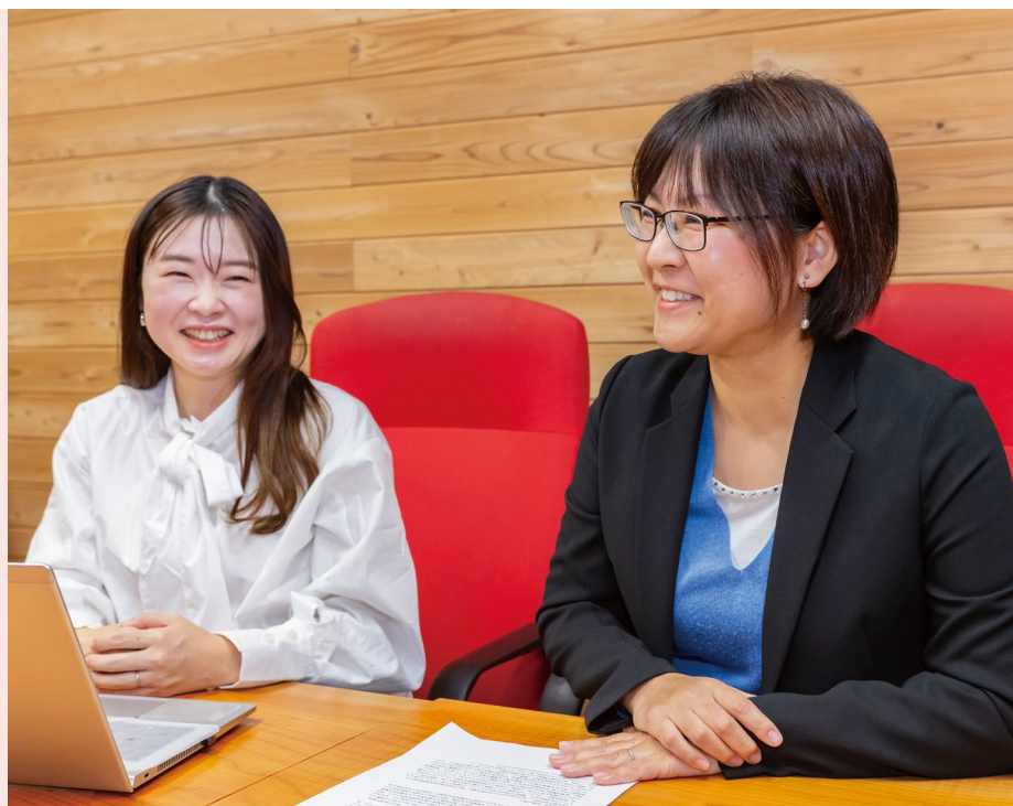
産休・育休を取得した女性従業員は「復職する際に不安はなかった」と口を揃える。