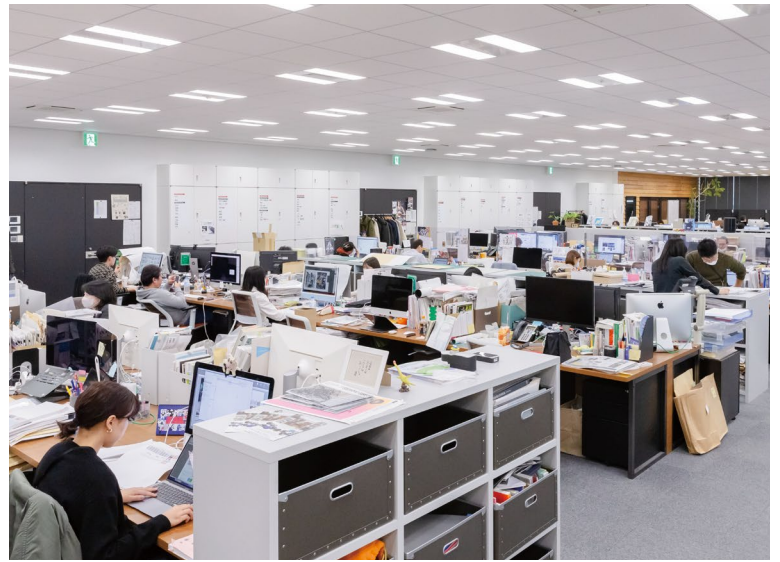
年齢を問わず多くの女性従業員が働くオフィスの風景。

22年夏に、全従業員のEX向上を目的とした全社横断プロジェクト「プロジェクトEX」がスタート。20代中心の男女若手従業員10名が抜擢され、入社前から現在に至るまでの自己体験を振り返る「従業員ジャーニーマップ」を作成した。「オンボーディング③」「キャリアパス」「ワーク・ライフ・バランス」に大きな課題があると絞り込み、若い同僚へのインタビュー調査、従業員ジャーニーマップ作成、評価分析、アイデア開発を実施し、そのレポートを全役員へ向けてプレゼン。デジタル教育ツールやキャリア形成支援の方法、リモートワークの促進、上司のあり方など、調査報告とアイデアを提案した。現在は、各部