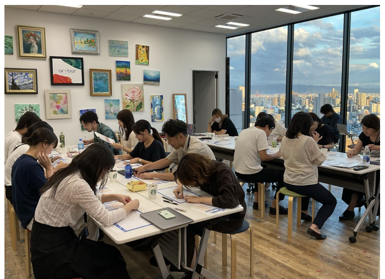
若い年齢層を対象に開催した人生設計ワークショップの様子

門長、課長クラスの従業員をEX推進メンバーとして選出。全従業員を対象にエンゲージメントサーベイ④による調査とその評価分析を重ねて、課題を絞り込んだ。EX推進メンバーは毎月一度、意見交換しながら改善への取組みを実施。「全従業員のEXをより高められるよう、継続して取り組んでいきたい。次の新しい取り組みも企画中です」と話したのは、現在のEX推進メンバー。プロジェクトを統括する女性取締役は、「進み具合や効果の現れはまだまだこれからの段階ですが、従業員の声を聞き、課題を見える化したのは大きな一歩だったと思います」と話した。