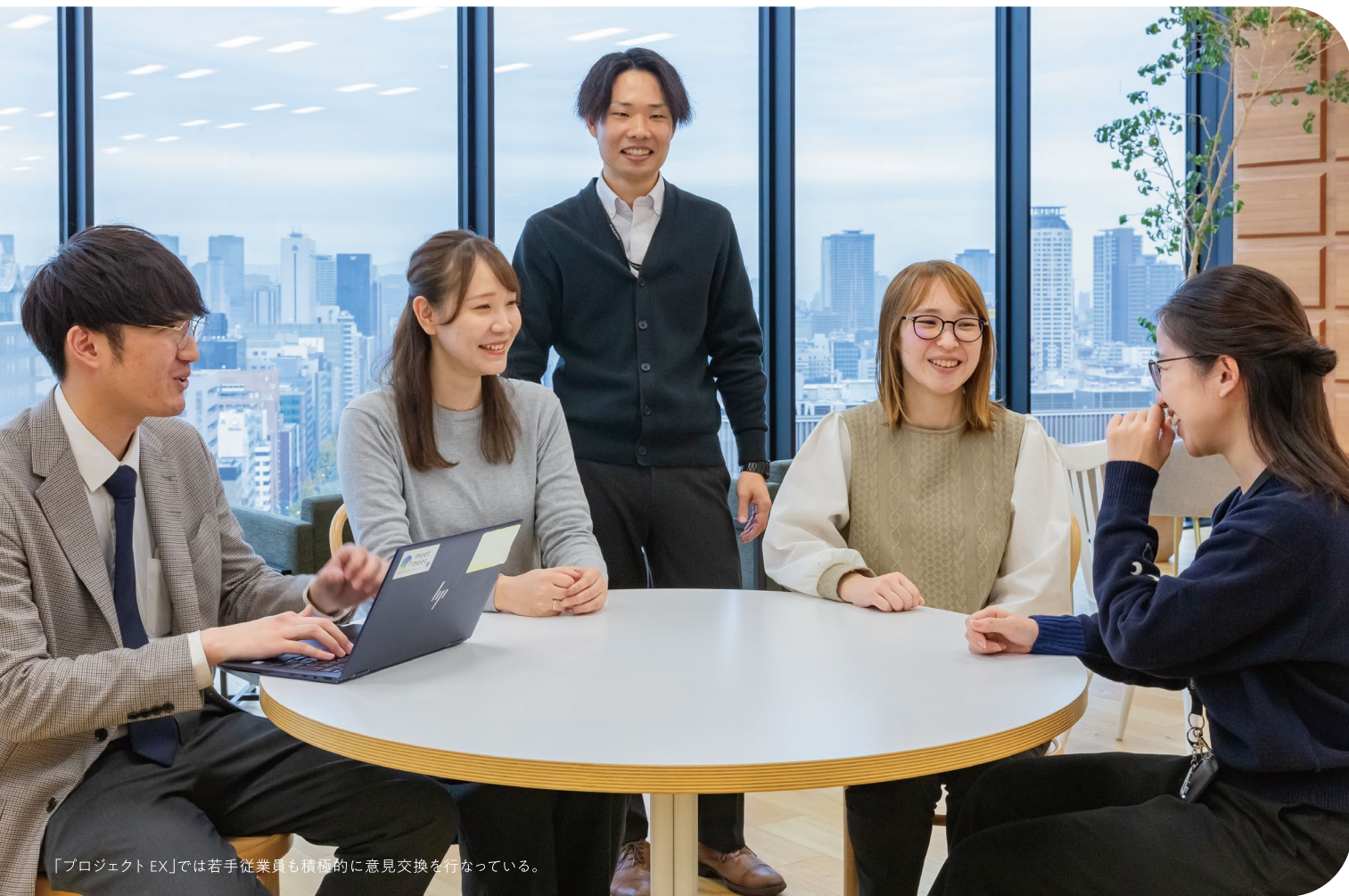
「プロジェクト EX」では若手従業員も積極的に意見交換を行なっている。

「デザインリサーチ事業」「マーケティングプロデュース事業」「プリンティング事業」の3つの事業を柱にした、デザイン、企画、デジタルマーケティング、調査・コンサルティング、アート印刷の専門集団。全社で働き方の多様化に取り組み、誰もがやりがいを感じながら成長できる仕組みを作ることをめざす。