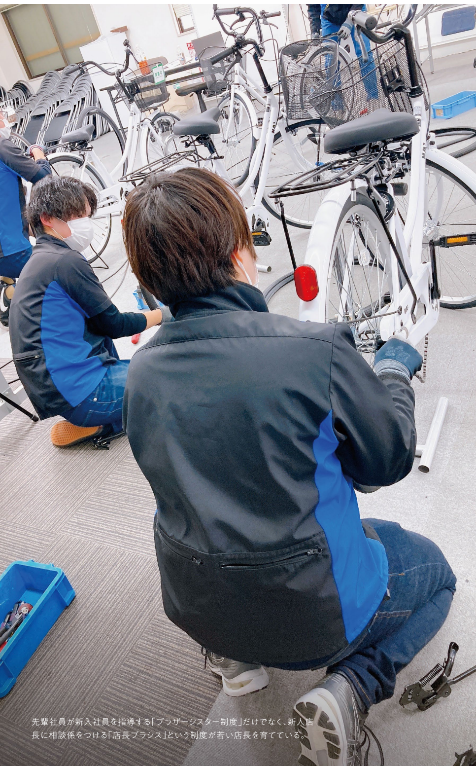
先輩社員が新入社員を指導する「ブラザーシスター制度」だけでなく、新人店長に相談係をつける「店長プラス」という制度が若い店長を育てている。

このような会社の取組について、30代の男性営業部長は「これまで、育児の取得は周りのスタッフへの迷惑だという意識が従業員の中にあり、男性育児の利用者があまりいませんでした。それを、会社からのメッセージの発信や制度の整備、そしてエリアマネージャーなどの上司が該当の社員に「とらへんの？」と声かけをするなどの心がけによって徐々に変わってきました。今では、出産や育児で大変な従業員をみんので支えよう、という気運が芽生えているように感じます」と話す。また、実際に育児を取得した20代の男性店長は「育児取得を後押しし、自分が不在の間、頑張ってくれたスタッフのおかげで、妻が日々どれだけ育児を頑張っているかを身近で感じ取ることができました。復職後はその体験により、仕事への取組や考えに変化を感じています。育児を頑張ってくれている妻と協力してくれた仲間への恩返しのために、これからも一層頑張っていきたいです」と振り返る。互いに助け合い、誰もが活躍できる会社に。当事者だけでなく、社内全体の意識に影響を与え、従業員一人ひとりが仕事と家庭を両立する。それにより充実した人生設計を思い描くことができ、仕事へのモチベーションへと繋がっているようだ。