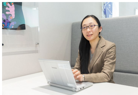
2021年に在宅勤務規定を改定し、在籍地と居住地を問わず週に5日のテレワークを可能とする「フル在宅勤務」制度を導入。積極的な改革を行う。