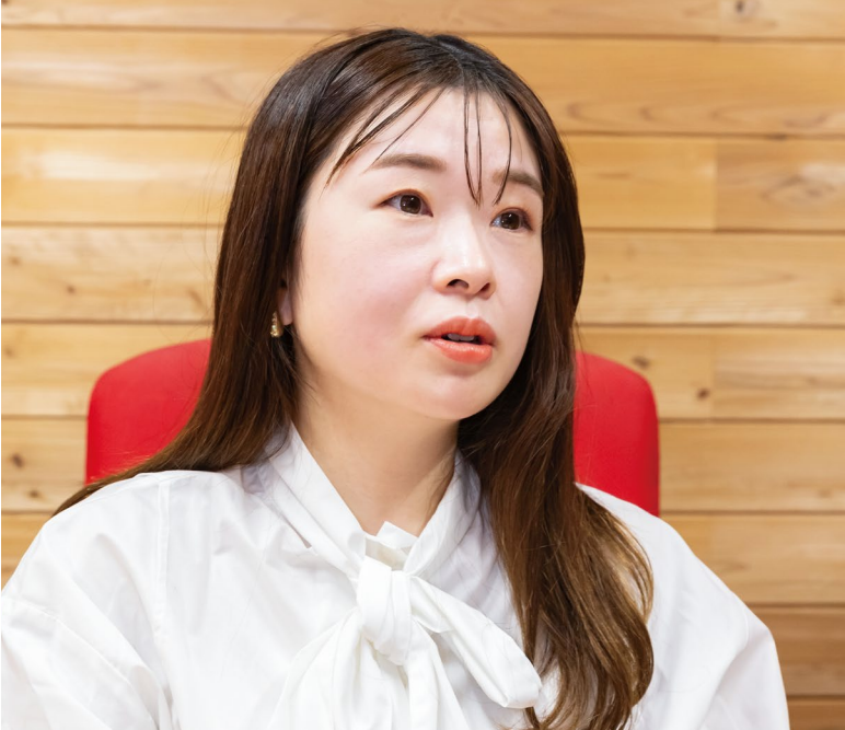
「時間ではなく能力で評価されることがモチベーションにつながっている」という。

これら働き方改革が実を結んでおり、育休取得経験のあるEUIビジネス部所属の女性従業員は「慣らし保育の期間を含めて約一年間休業しましたが、先に取得されていた先輩が復帰後もしっかりと仕事をされている姿を見ていたので、不安はありませんでした」と回答。17年に第一子の出産に向けて育休を取得した総務・人事チームの女性従業員も「安心して育休に入り、変わることなく仕事に戻ることができました」と話す。また、育児のため入社時から短時間勤務を利用してしている女性従業員が「ユニオンシンクでは勤務時間ではなく能力が評価されるので、それが会社に貢献したいというモチベーションにつながっている」と話すが、働き方改革の多様性が従業員の気持ちに大きく影響していることが分かる。19年に7カ月の育児休業を取得した男性従業員は、「復職後は意外なほど問題なく業務に戻れ、身に付いた業務経験は半年くらいは休業で忘れることはないんだなと実感しました。コロナ禍で大変な時期でしたが、すぐに在宅勤務などの柔軟な対応が全社的に開始されたため、大きな問題もなく育児と業務を両立できました」と話すなど、男性従業員全般にも複数回に分けての育児休業取得や時短勤務の活用などが広がっており、従業員が安心して業務を続けられる企業風土が醸成されている。