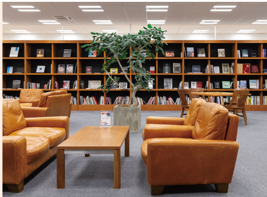
デザインやアートに携わる企業らしく待合スペースもおしゃれ。