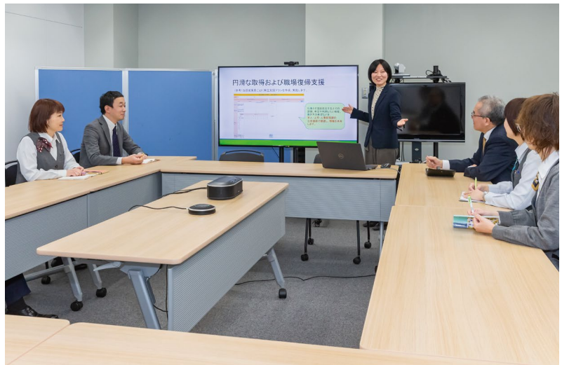
会議には性別、職種を問わずたくさんの従業員が参加する。事務職の女性従業員も、会議に参加する機会があることで仕事に対する意識が変わってきたという。

21年には男性初の育児休業の取得者が誕生。「初の取得者が営業部のマネジャー職であり、詳細な育児休業取得体験記を社内へ発信してくれたので、挑戦すれば何でもできるという雰囲気になってきています」とは人事部長のKさん。 また、育児のため23年より時差出勤を利用している管理部マネジャーの男性従業員が、「時差出勤で家庭や仕事での取り組み方が大きく変わりました。今は男性が子育てに参加することが当たり前になってきているので、今後もたくさん男性従業員が制度を利用してほしい」と語るなど、同社の取り組みが社内全体に広がっていることを感じさせる。