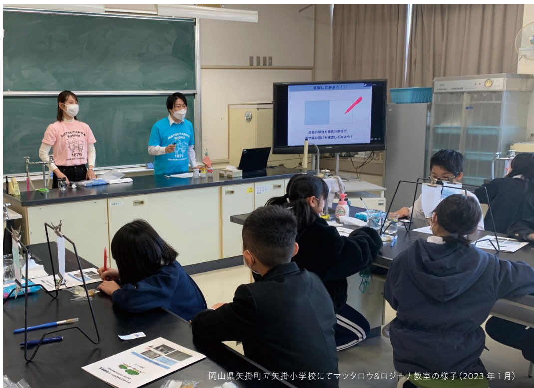
岡山県矢掛町立矢掛小学校にてマツタロウ&ロジーナ教室の様子（2023年1月）