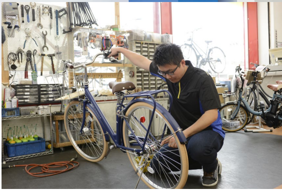
「要望がなくても空気を入れておく、オイルを注しておく。こういう少しの思いやりを、弊社では“おせっかい”という合言葉にして浸透させています」という。

1980年創業。「ダイワサイクル」「ダイワサイクルSTYLE」の2業態を中心に、関西、関東、愛知に106店舗（2023年2月時点）を展開、毎年20店舗ペースで出店を続ける。近鉄八尾駅前の駐輪場から始まった創業の思いを受け継ぎ、突然のアクシデントに店舗スタッフが駆けつける出張修理を行うなど、昔ながらの「おせっかい」を信条に顧客と向き合う。