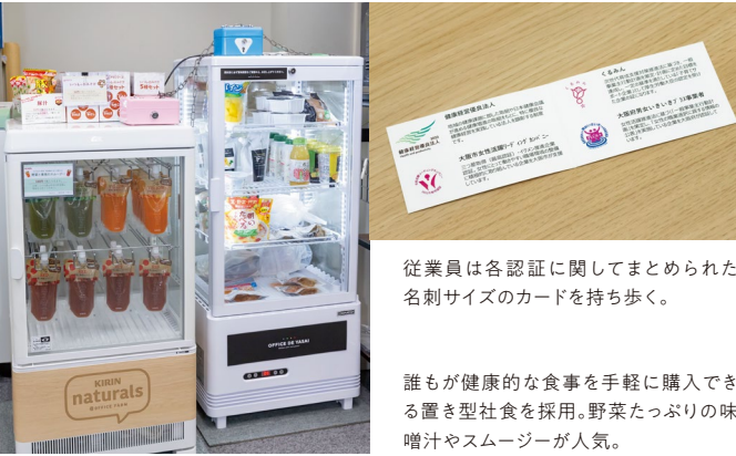
従業員は各認証に関してまとめられた名刺サイズのカードを持ち歩く。